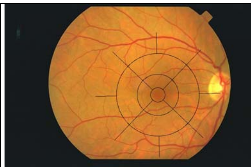
Rétine normale

Les participants volontaires à cette étude ont été recrutés, de juin 1995 à juillet 1997, par des appels dans la presse locale, par téléphone, par courrier ou sur des listes électorales. Un camion équipé d'appareils d'ophtalmologie se déplaçait dans la ville pour les rencontrer. Le premier volet de l'enquête consistait à les interroger sur leur histoire médicale et leurs lieux de résidence successifs, depuis leur naissance, ainsi que sur leur mode de vie, en particulier leurs comportements vis-à-vis du soleil : exposition professionnelle, exposition liée aux loisirs (plage, ski, pêche, voile...), port de lunettes de soleil. En parallèle, des mesures cliniques (tension artérielle) et anthropométriques (poids, taille...) étaient pratiquées, ainsi qu'un bilan biologique (glycémie, lipides sanguins...). Enfin, un examen ophtalmologique détaillé était également réalisé chez les participants.